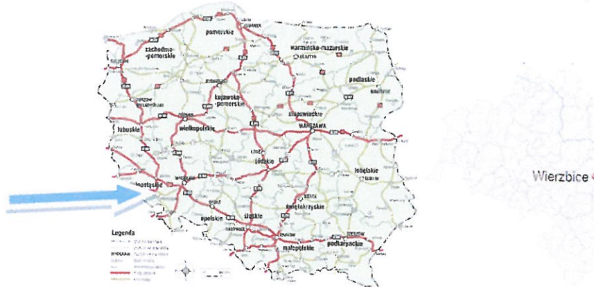
Rys. 1,2. Lokalizacja miejscowości w której znajduje się wyceniana nieruchomość w Polsce i woj. dolnośląskim.

Powiat wrocławski położony jest w środkowo-wschodniej części województwa dolnośląskiego, w bezpośrednim sąsiedztwie Miasta Wrocławia. Graniczy z powiatami ziemskimi: dzierzoniowskim, oleśnickim, oławskim, strzelińskim, średzkim, świdnickim i trzebnickim. Zajmuje powierzchnię 1118 km 2 i jest trzecim co do wielkości powiatem w województwie. Powiat obejmuje trzy gminy miejsko-wiejskie: Kąty Wrocławskie, Sobótka i Siechnice oraz 6 gmin wiejskich: Czernica, Długoleka, Jordanów Śląski, Kobierzyce, Mietków i Żarówina. Zgodnie z danymi Głównego Urzędu Statystycznego z 2014 r. składa się na nie łącznie 214 sołectw i 231 miejscowości (w tym 3 miasta: Kąty Wrocławskie, Siechnice i Sobótka).