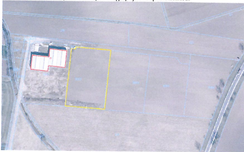
Rys. 5. Granice (orientacyjne) wycenianej nieruchomości.

Dla wycenianej działki, w przypadku realizacji zabudowy na działce, niezbędne jest przeprowadzenie procedury wyłączenia gruntu rolnego z produkcji rolniczej. Szacunkowy koszt przeprowadzenia w/w procedury określono na poziomie ok. 25 zł/m 2 .