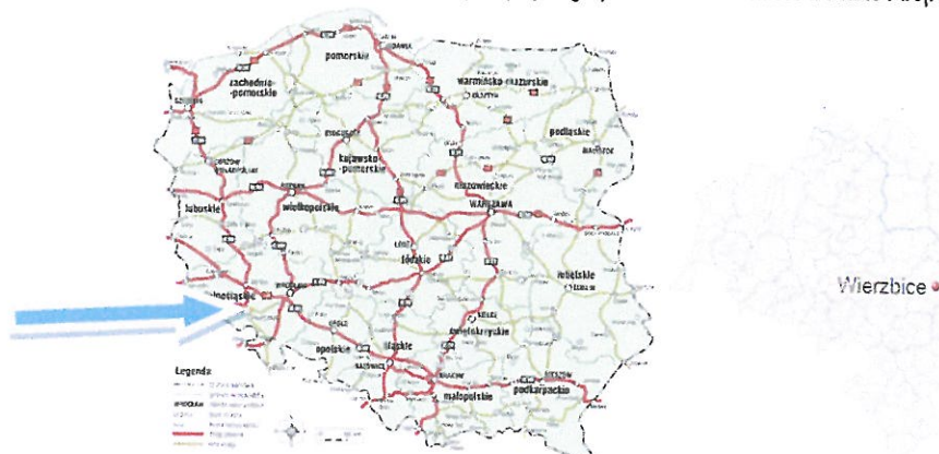
Rys. 1,2. Lokalizacja miejscowości w której znajduje się wyceniana nieruchomość w Polsce i woj. dolnośląskim.

Powiat wrocławski położony jest w środkowo-wschodniej części województwa dolnośląskiego, w bezpośrednim sąsiedztwie Miasta Wrocławia. Graniczy z powiatami ziemskimi: dzierżoniowskim, oleśnickim, oławskim, strzelińskim, średzkim, świdnickim i trzebnickim. Zajmuje powierzchnię 1118 km 2 i jest trzecim co do wielkości powiatem w województwie. Powiat obejmuje trzy gminy miejsko-wiejskie: Kąty Wrocławskie, Sobótka i Siechnice oraz 6 gmin wiejskich: Czernica, Długoleś, Jordanów Śląski, Kobierzyce, Mietków i Żórawina. Zgodnie z danymi Głównego Urzędu Statystycznego z 2014 r. składa się na nie łącznie 214 sołectw i 231 miejscowości (w tym 3 miasta: Kąty Wrocławskie, Siechnice i Sobótka).