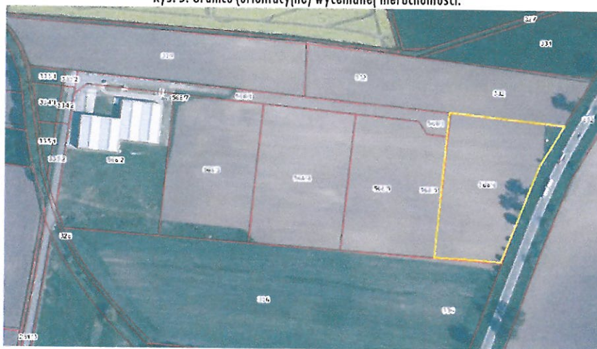
Rys. 5. Granice (orientacyjne) wycenianej nieruchomości.

Działka posiada bezpośredni dostęp do drogi publicznej – droga krajowa nr 8, bez możliwości wjazdu. Najbliższa droga publiczna z możliwością wjazdu – asfaltowa lokalna droga gminna (ul. Kobierzycka) znajduje się w odległości 350m od wycenianej nieruchomości. Dojazd do wycenianej nieruchomości zaplanowany jest poprzez drogę wewnętrzną (działkę nr 568/1 – służebność drogową). Działka nr 568/1 jest tylko częściowo urządzoną drogą wewnętrzną, na odcinku ok. 80m od ul. Kobierzyckiej pokryta asfaltem, następnie na odcinku ok. 60m jest wytyczona za pomocą krawężników i pokryta szutrem. Dalej w kierunku działki nr 568/6 jest nieurządzona, stanowi pole uprawne.