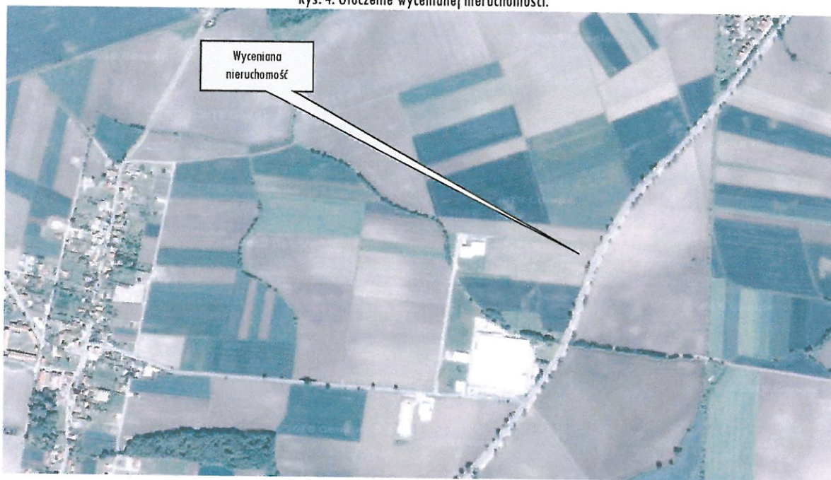
Rys. 4. Otoczenie wycenianej nieruchomości.

Bezpośrednie otoczenie wycenianej nieruchomości to działka zabudowana halą produkcyjno-magazynową, niezabudowane działki użytkowane rolniczo, w odległości 300m znajduje się zakład produkcyjny LEONI Kabel Polska Sp. z o.o., kompleks zabudowy produkcyjno-magazynowej o powierzchni zabudowy ok. 28 000m 2 .